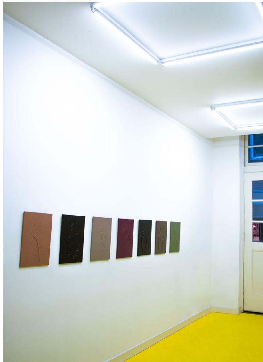
Vue du solo-show Esthétiques de l'herbe indigne , à la San Serriffe, octobre 2023, Amsterdam.