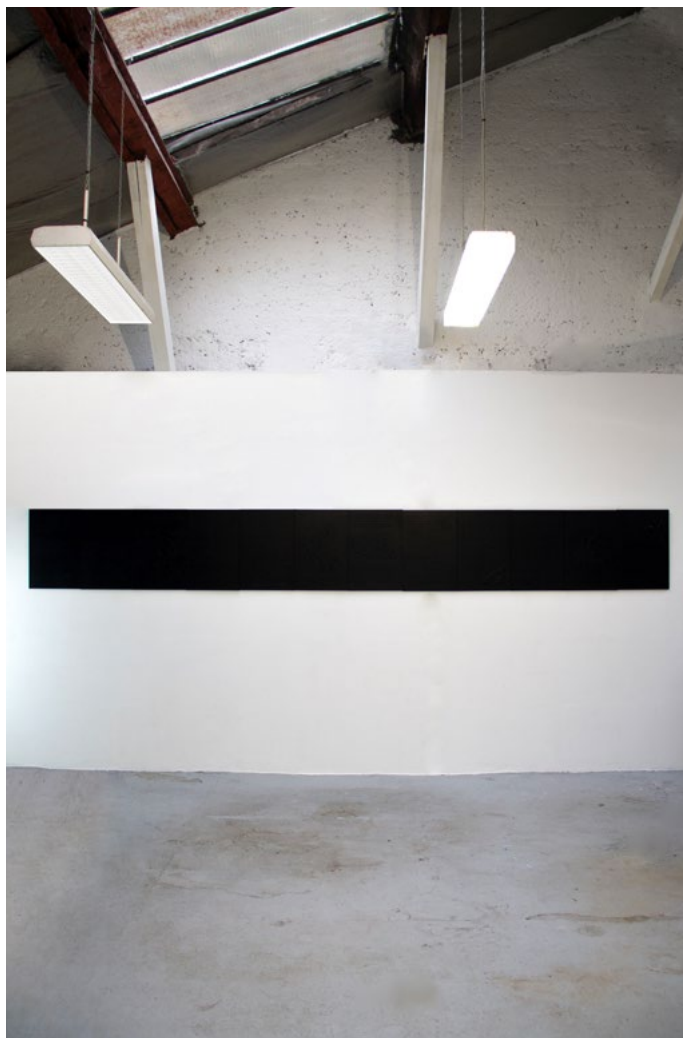
You are entering a zone of exception , 50cm x 4,80m, cuir, bois, objets prélevés, vue d'atelier, Lyon, 2023.

Commande de l'Université de Genève (Centre Maurice Chalumeau en Science des Sexualités)