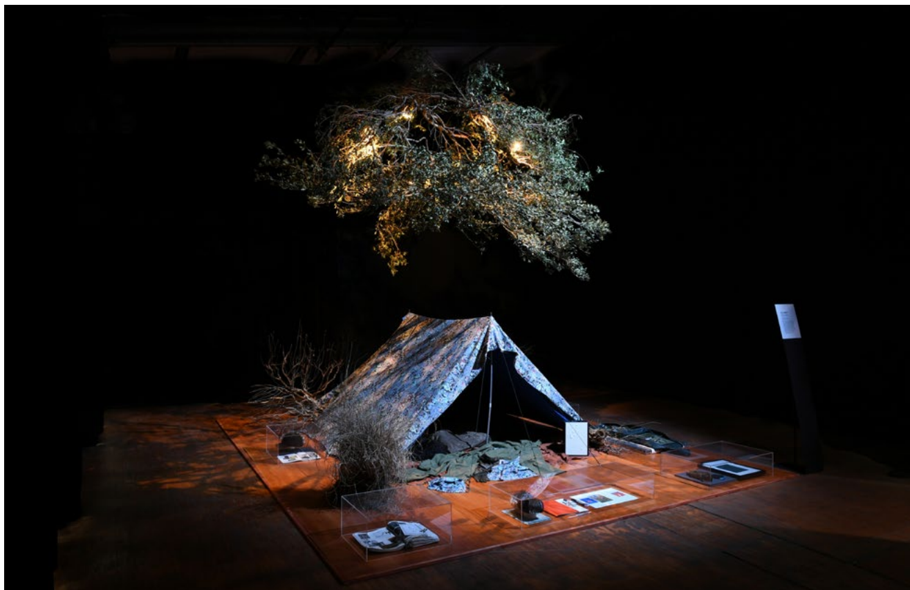
Installation partielle de Battue en cours à la grande halle de la Villette, 100% l'Expo, commissariat: Inès Geoffroy, avril 2022.

Mon travail consiste à observer et archiver les histoires qui s'y construisent, et faire émerger les dialogues visuels et esthétiques qui naissent des interactions entre les hommes et cette nature. Ma démarche est de me rendre sur le lieu par mes propres moyens, de me fondre dans le décor en toute discrétion, et de faire l'état du lieu tel qu'il est, sans chercher à le dénaturer. J'élabore des objets fonctionnels et poétiques en réponse aux découvertes et besoins rencontrés pendant mon enquête-collecte. En faisant appel à nos sens, mon travail crée un ensemble d'artefacts qui équipent la figure du chasseur-cueilleur que j'incarne.