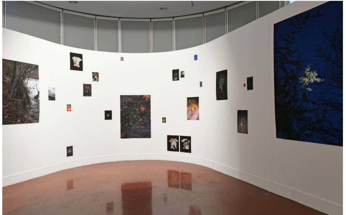
Vue d'exposition à Battue en cours , à la Rotonde Rosa Bonheur (Ensad), juillet 2021, Paris.