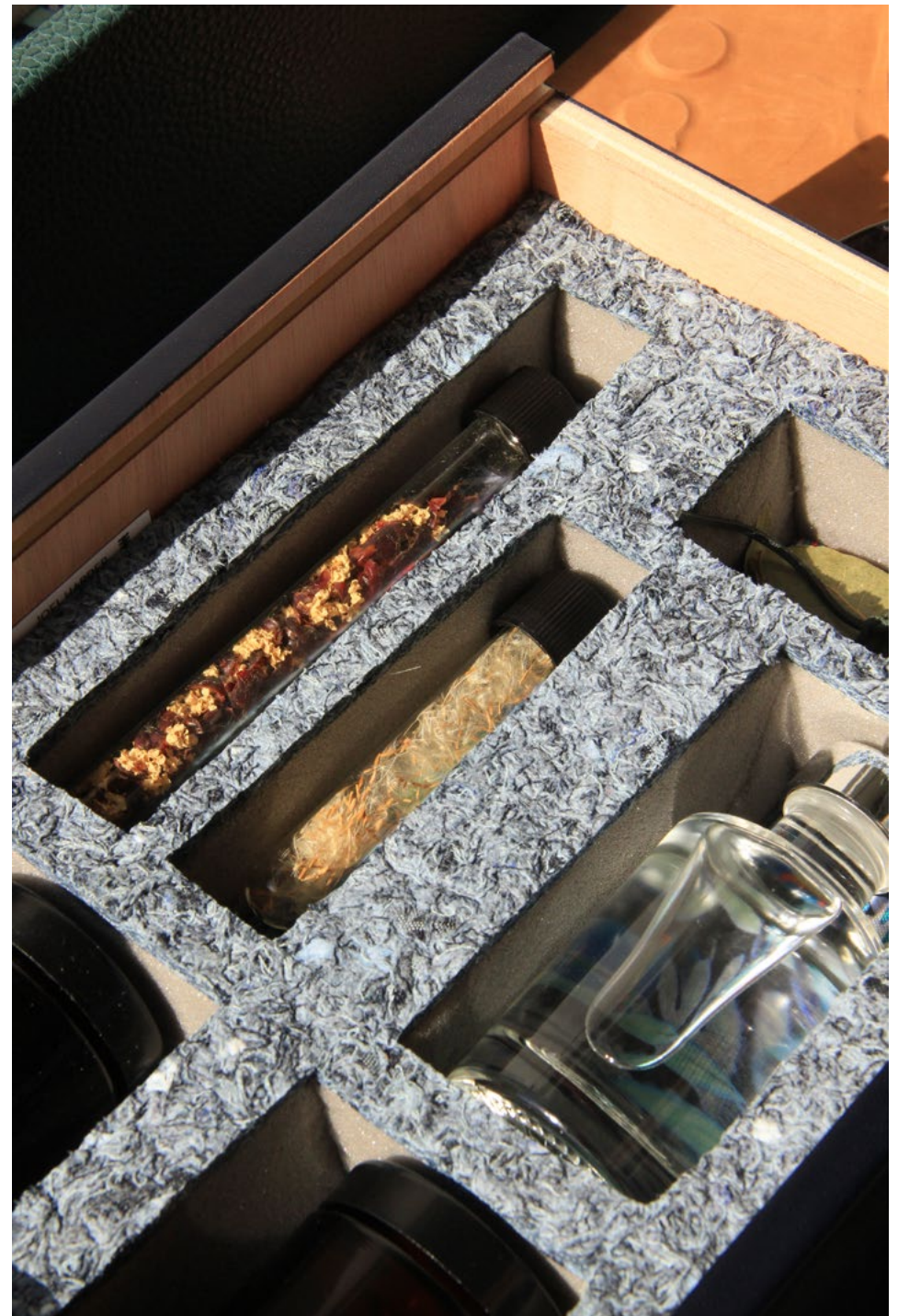
Poèmes gustatifs, vue d'atelier, Lyon, 2023.