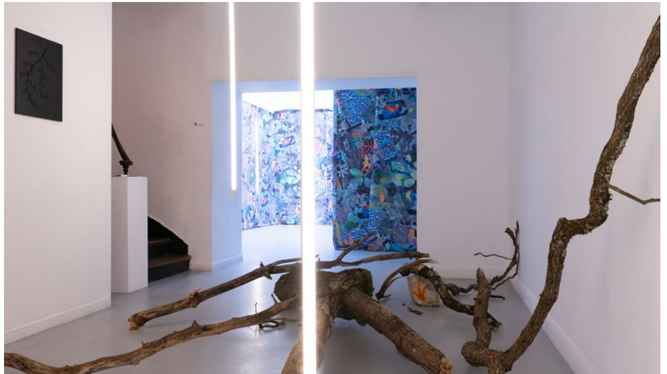
Vue du solo-show Se peupler d'ombres , à la Galerie du Crous de Paris, commissariat: Daphné Brottet, avril 2024.

Il travaille en partenariat et en co-création avec des personnes (nez, urbanistes, graphistes, herboristes, selliers-garnisseurs, etc.) dont la pratique fait écho aux projets multisensoriels qu'il entreprend.