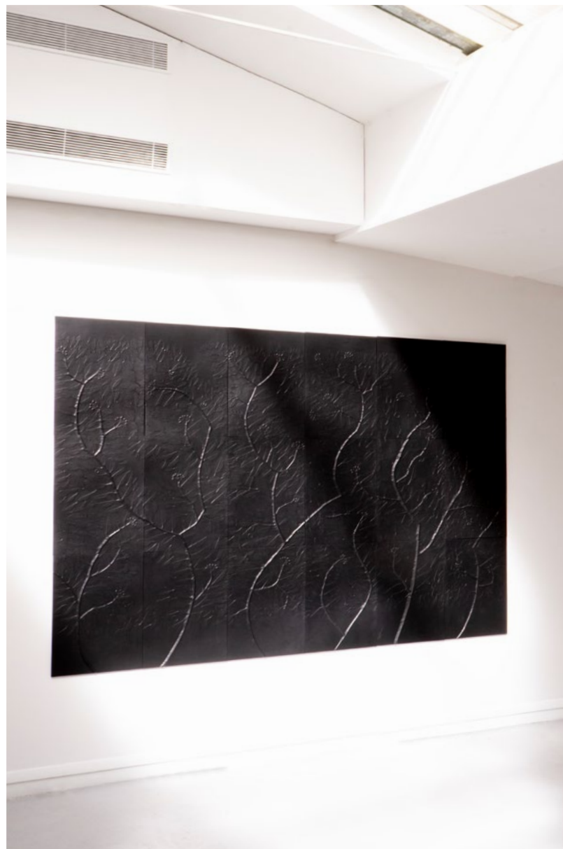
Vue du solo-show Se peupler d'ombres , à la Galerie du Crous de Paris, commissariat: Daphné Brottet, avril 2024.

Les Em-preintes (série des adventices) présente des pièces qui archivent et documentent le sentiment nostalgique de la disparition. Des végétaux et objets sont collectés à proximité de lieux de drague avant qu'il ne soit réaménagé, et sont conservés par une technique qui consiste en un moulage méthodique et méticuleux de ces objets avec une peau animale. En résulte un linceul qui recouvre la plante et la laisse mourir doucement. Tout au long du séchage progressif de la peau et de la plante, le moulage se poursuit et est retravaillé jusqu'à obtenir le végétal dans une forme pérenne. En collaboration avec des artisans selliers-garnisseurs, le cuir est travaillé pour arriver à une extrême finesse, amenant cette matière aux limites de sa matérialité. Ces herbiers ont pour point de départ la technique d' oshibana , art floral pratiqué au Japon.