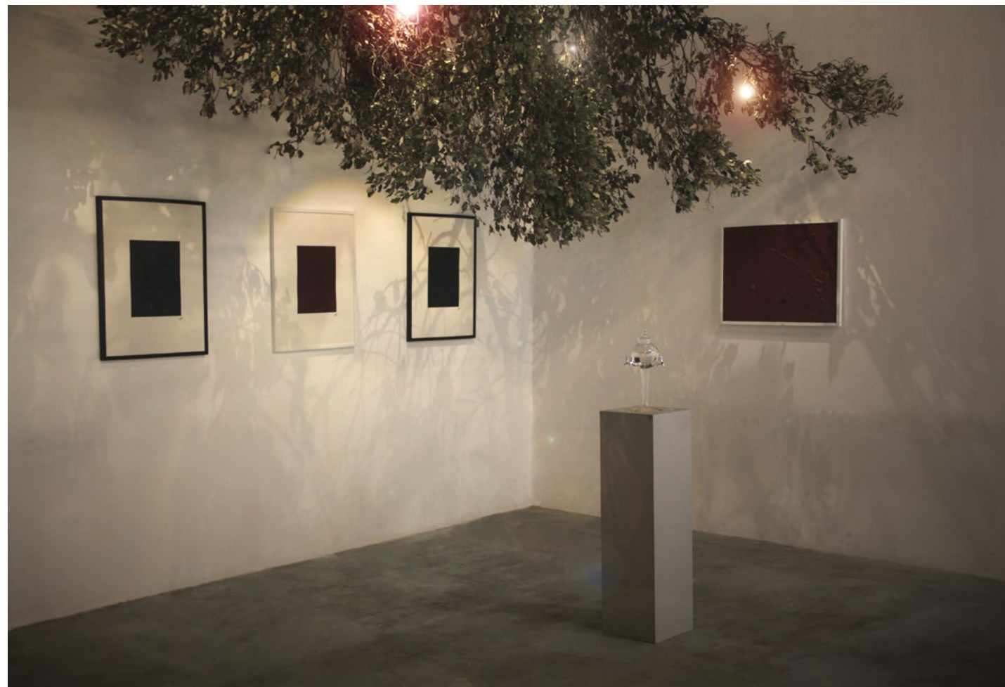
Vue d'exposition à l'exposition collective Partages , Artaïs, curatée par Sylvie Fontaine et Maya Sachweh, octobre 2022, Paris. Co-production avec Artaïs Art Contemporain (Paris) and Distillerie Helvia.