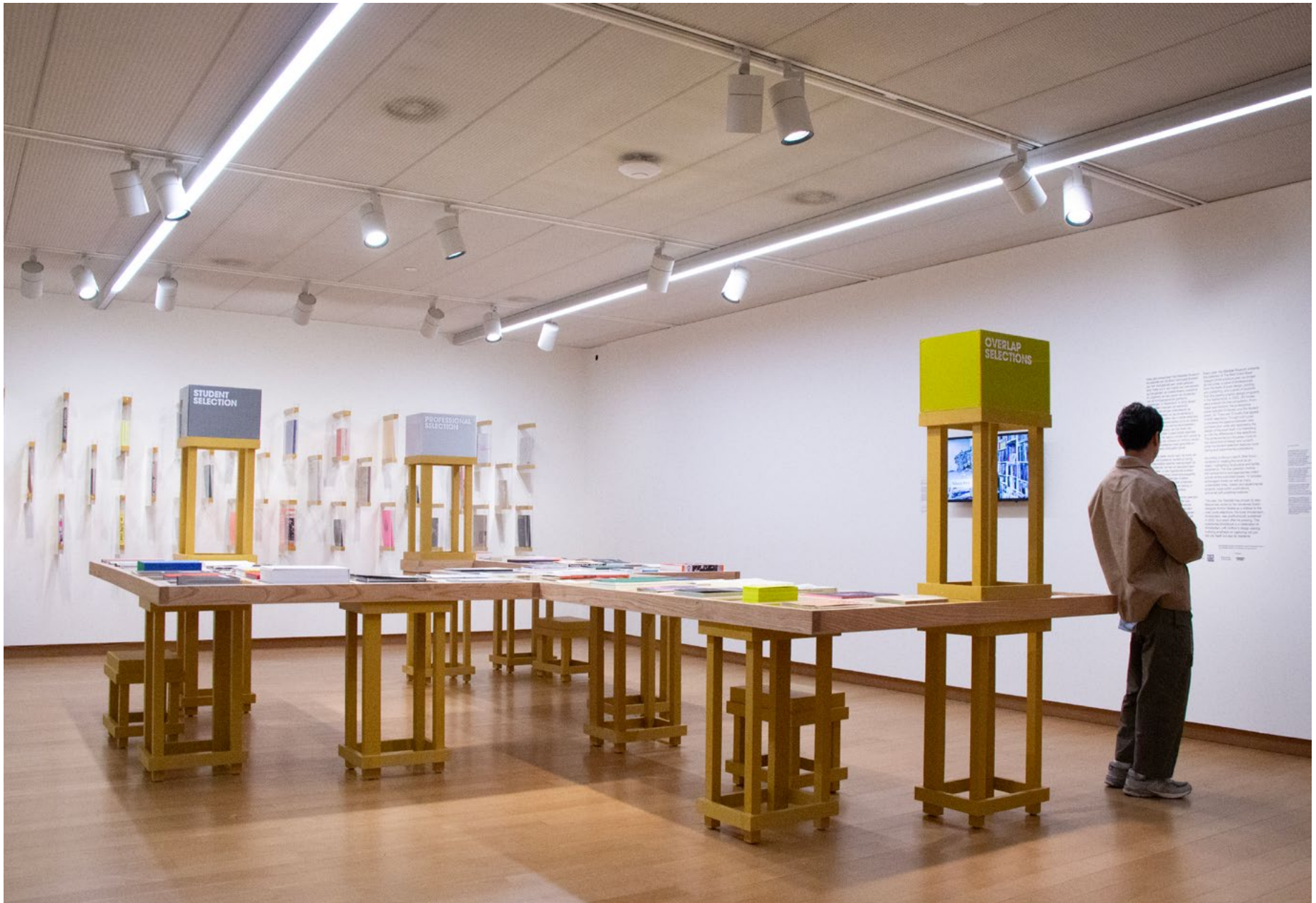
Vue de l'exposition The Best Dutch Book Designs of 2022 , Stedelijk Museum, octobre 2023, Amsterdam.