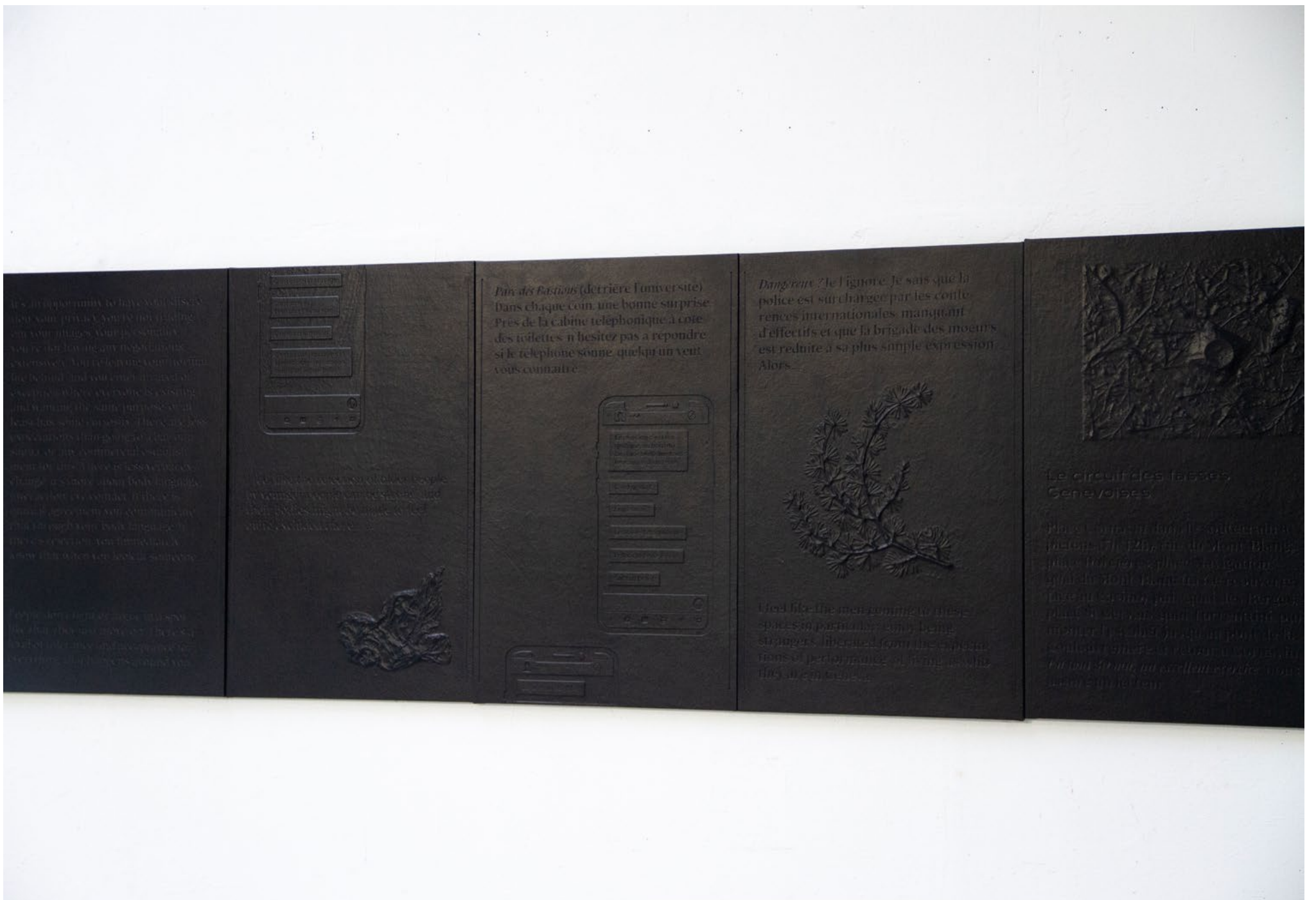
You are entering a zone of exception , 50cm x 4.80m, cuir, bois, objets prélevés, vue d'atelier, Lyon, 2023.