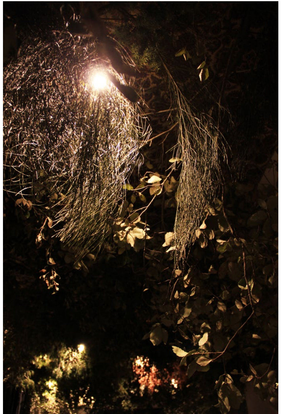
Vue d'exposition à l'exposition collective Partages , Artaïs, curatée par Sylvie Fontaine et Maya Sachweh, octobre 2022, Paris. Co-production avec Artaïs Art Contemporain (Paris) and Distillerie Helvia.